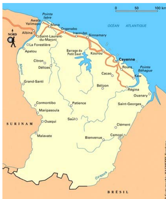
Figura 1 – Mapa da Guiana Francesa 2

A Guiana Francesa (Guyane Française) está no rol de uma das seis regiões mais remotas da União Europeia (UE), conhecidas como as regiões ultraperiféricas (RUP), as quais fazem parte do Departamento Ultramarino Francês: Martinica, Maiote, Guadalupe, Guiana Francesa e Reunião. A França também dispõe de uma coletividade ultramarina denominada de São Martinho desde o ano de 2009. Possui uma área de 84.000 Km 2 , sua capital é Cayenne 3 e é também a maior cidade, sua população totaliza 267.000 habitantes (estimativa de 2014), todavia é pequena em comparação com o tamanho do território. A maioria dos habitantes vive em áreas urbanas ao longo da costa. (Guiana Francesa, 2016, p. 1), os quais fixam moradias pelos 19 municípios (Cayenne, Saint-Laurent-du-Maroni, Matoury, Kourou, Remire-Montjoly, Macouria, Mana, Maripasoula, Apatou, Grand-Santi, Saint-Georges 3 , Papaïchton, Sinnamary, Roura, Montsinéry-Tonnegrande, Iracoubo, Camopi, Awala Yalimapo, Régina) (SILVA et al, 2016, p. 11).