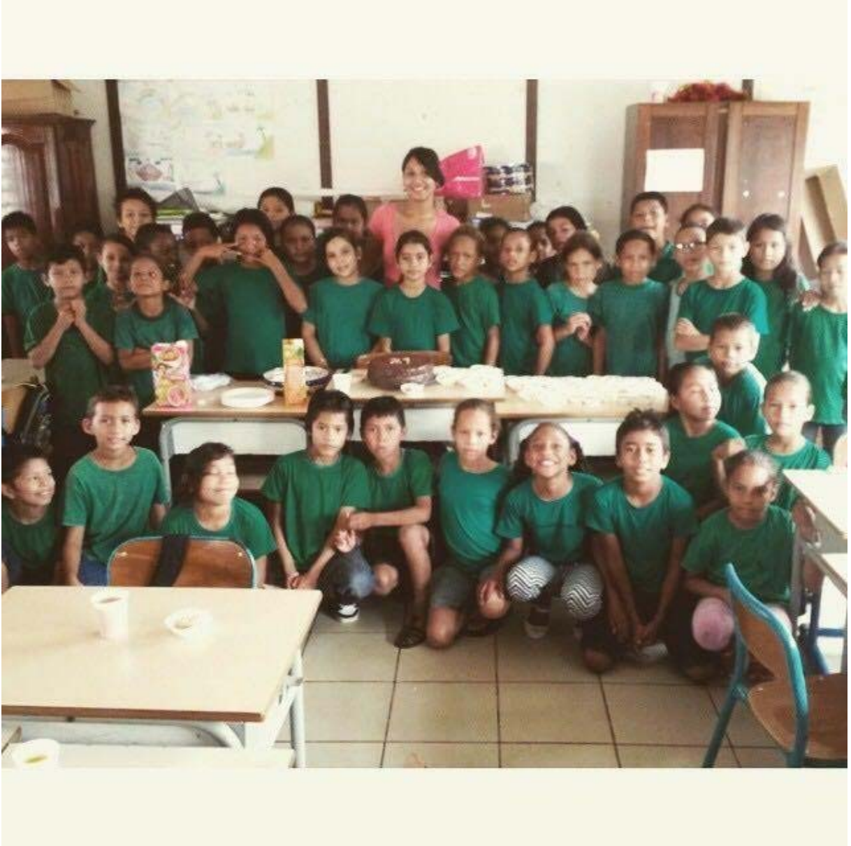
Classe de PLE – Saint-Georges (Guiana Française)