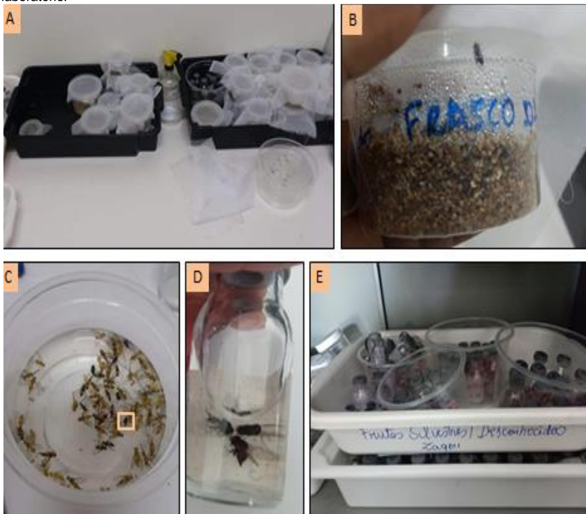
Figura 5 - Fotografias da verificação de emergência e obtenção das moscas-das-frutas obtidos em laboratório.

Foto: A= Verificação dos fracos; B= Frasco com emergência de inseto; C= Sacrifício dos insetos; D= Armazenamento das moscas sacrificadas em recipiente de vidros; E= Armazenamento dos fracos com insetos.