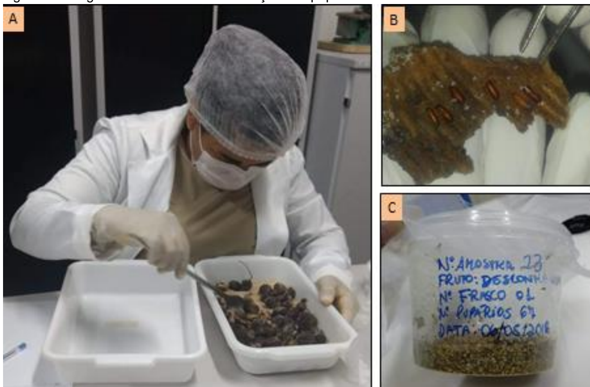
Foto: A= Amostra em verificação; B= Obtenção de pupários; C= Frasco com substrato e pulpa.

Os frascos foram identificados com informações como: número do frasco da amostra, data, nome do fruto e quantidade de pupários adquiridos de cada verificação até o descarte das amostras (até cinco verificações) (fotografia 4 c). Diariamente os frascos foram examinados e conforme a necessidade foi umedecido o substrato (vermiculita) contido nos frascos. A cada verificação das amostras contendo frutos e/ou pupários, registros eram feitos para controle e acompanhamento em laboratório.