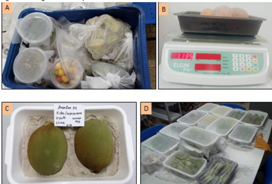
Figura 2 - Fotografias das etapas de coletas

Foto: A= caixa plástica e coletas; B= balança/pesagem dos frutos; C= bandeja contendo areia esterilizada/ frutos acondicionados; D= bandeja coberta com organza/amostras processadas.