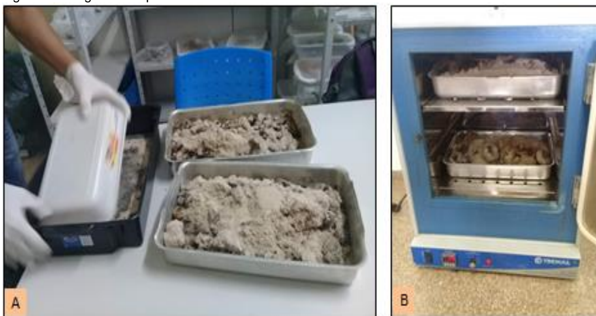
Figura 6- Fotografias do processamento e do descarte das amostras.

Foto: A= Bandejas com substratos para descarte; B= Estufa.