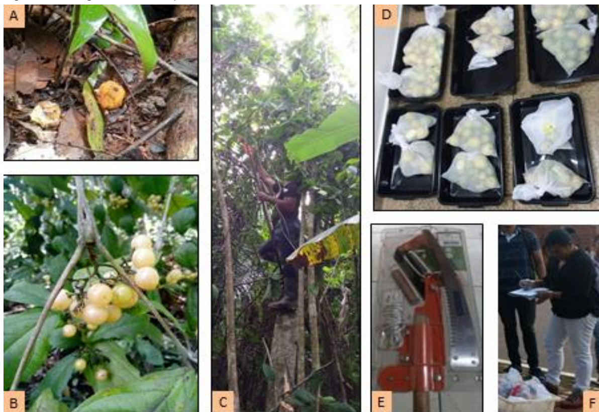
Figura 1- Fotografias das etapas de coleta dos frutos.

Foto: A= Fruto no solo; B= Fruto na árvore; C= coleta com instrumento podão; D =Frutos acondicionados em saco de organza; E= instrumento podão; F= Registro da coleta em planilha.