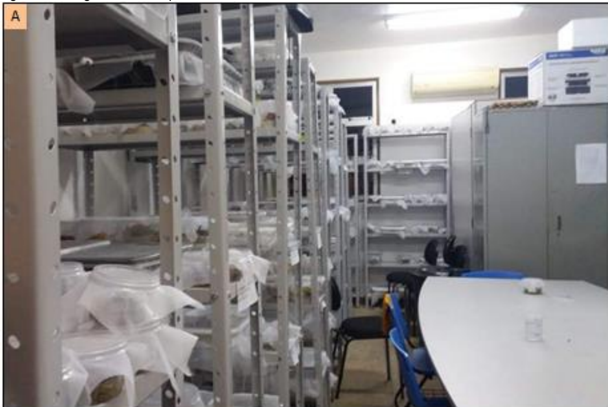
Figura 3- Fotografia dos recipientes com amostras de frutos.

Foto: A = Estante de armazenamento das amostras para verificação.