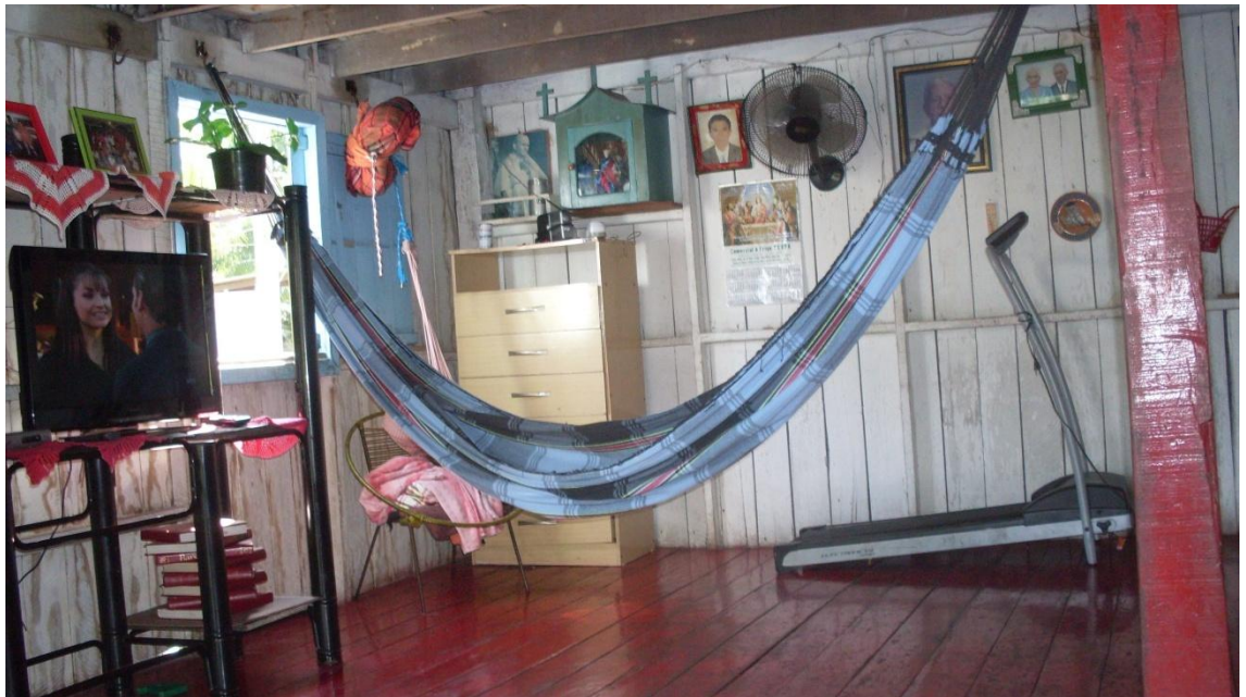
Figura 12 – Rede utilizada para descanso ou para ver televisão.

Relatando o morador 4: “Aqui é calmo de tarde, a quieta tá pra escola esse horário. Temo que descansar, aproveitar, né?” e o morador 3: “Se eu não deitar minha perna fica fraca, fraca, eu não aguento”.