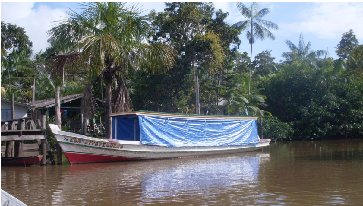
Figura 5 – Comunidade Igarapé do Samaúma também conhecida como “Jito Pequeno”

A Comunidade Ribeirinha Igarapé do Samaúma, historicamente também conhecida como “Jito Pequeno”, costuma ser um lugar pacato e silencioso, silêncio constantemente quebrado pelo barulho dos motores dos barcos, em que o rio e as árvores fazem parte da paisagem como vemos na Figura 5.