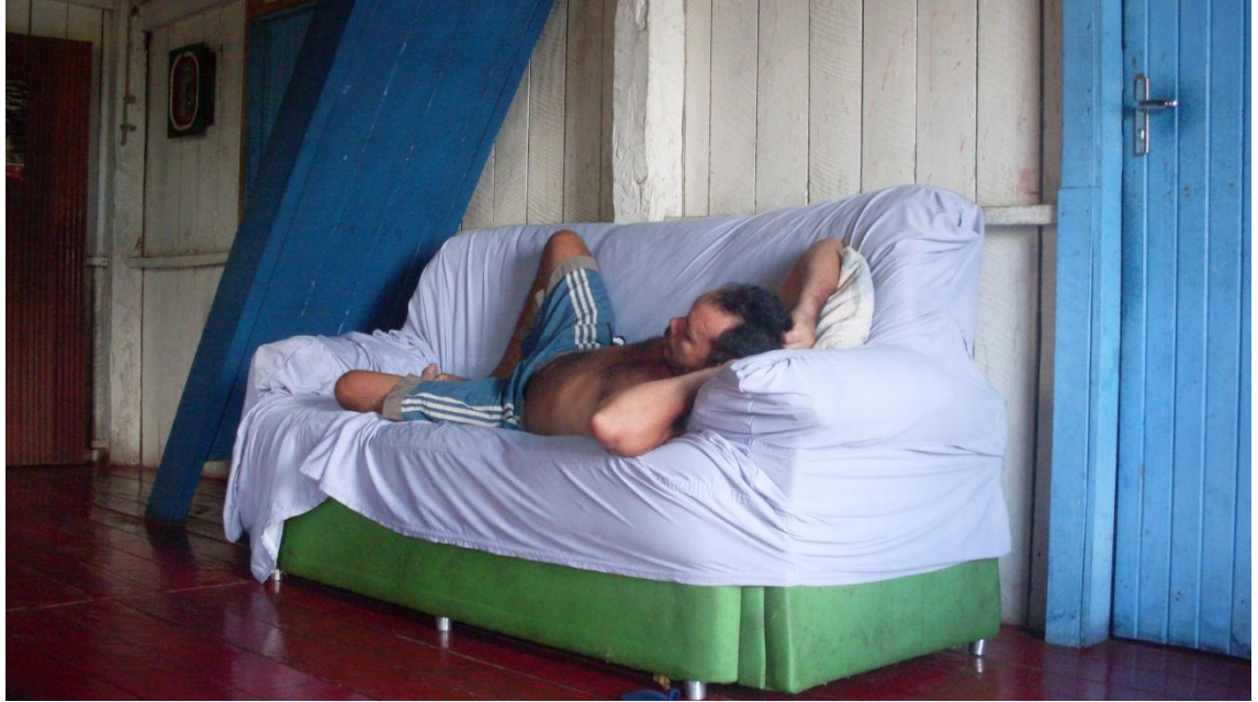
Figura 13 – Período de descanso da tarde

Sobre essas manifestações corporais culturais e a maneira como se materializam na vida das pessoas, Soares et al (1992, p.39) ainda afirmam que “a materialidade corpórea foi historicamente construída e, portanto, existe uma cultura corporal, resultado de conhecimentos socialmente produzidos e historicamente acumulados pela humanidade que necessitam ser retraçados e transmitidos”