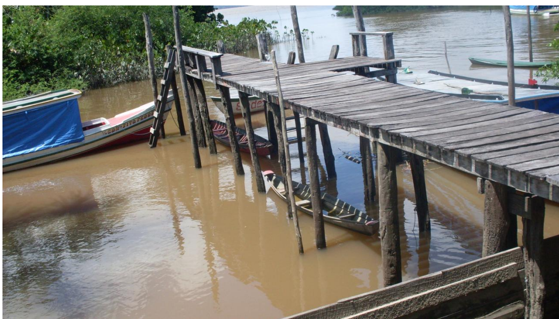
Figura 6 – Ponte sobre o rio na Comunidade Igarapé do Samaúma

Em um local que a água cerca e define os caminhos, em que o rio é a rua (Figura 6), o homem/mulher precisa criar condições favoráveis para viver da melhor maneira, essas adaptações que tornam esta realidade singular acabam delineando a cultura do local. Esta relação pode ser percebida na narrativa dos moradores, como podemos ver na fala do morador 2: “Tem época que tá bom pra pescar, mas tem época que num dá nada” ou mesmo no caminho entre a uma margem e a outra em que dependendo se a maré está cheia ou não pode-se pegar um “atalho” pelos furos das ilhas.