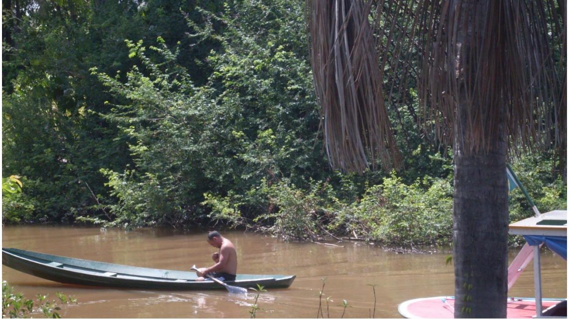
Figura 10 – Ribeirinho deslocando-se em sua canoa