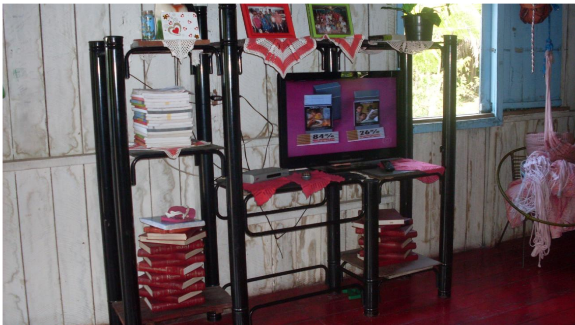
Figura 8 – Televisão da casa do morador 2

A cultura é um sistema simbólico, claramente possível pelo isolamento histórico de grupos humanos, expressa as relações próprias da comunidade, passando por gerações até caracterizar-se como um sistema integrado de ações conjuntas, identificadas por suas ideologias, crenças, expressões, formas de ser e de estar. (GEERTZ, 1989, p.22)