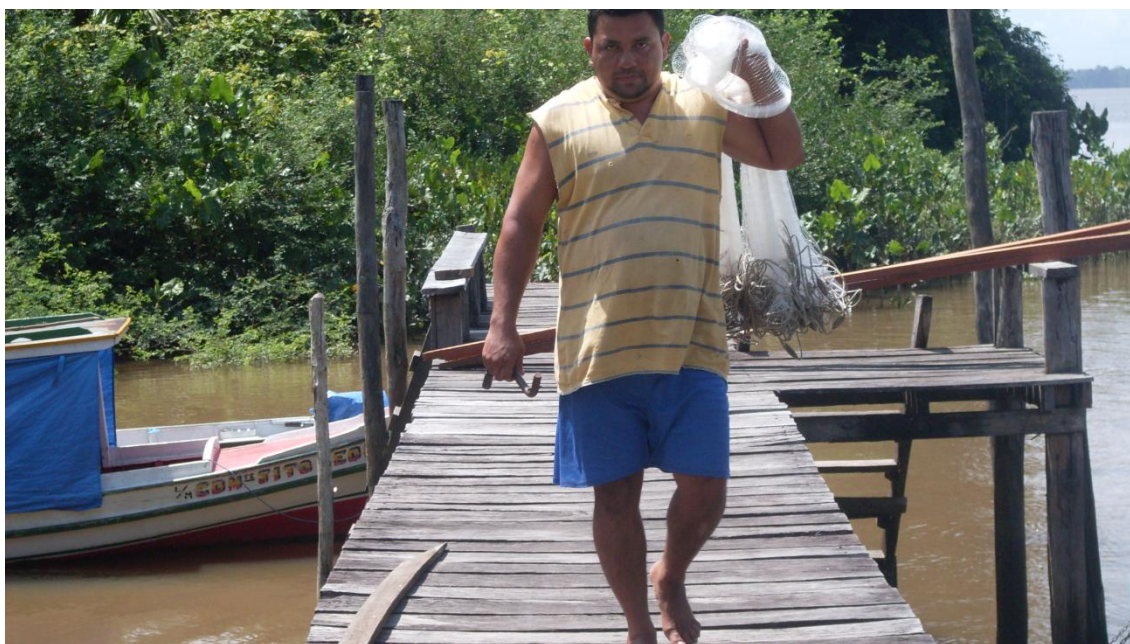
Figura 14 – Ribeirinho carregando a tarrafa

Para , Daolio (1995, p. 39) “no corpo estão inscritos todas as regras, todas as normas e todos os valores de uma sociedade específica, por ser ele o meio de conta o primário do indivíduo com o ambiente que o cerca”. Ao identificar e analisar esse conjunto de regras, normas e valores em um indivíduo, pode se compreender uma sociedade particular, uma vez que no corpo estão impressos os códigos culturais de tal sociedade. Daolio diz que: “mais do que um aprendizado intelectual, o indivíduo adquire um conteúdo cultural, que se instala no seu corpo, no conjunto de suas expressões. Em outros termos, o homem aprende a cultura por meio do seu corpo.”(DAOLIO, 1995, p.40). A aprendizagem em um grupo cultural também passa pelo conjunto de percepções e usos que se tem e se fazem do corpo.