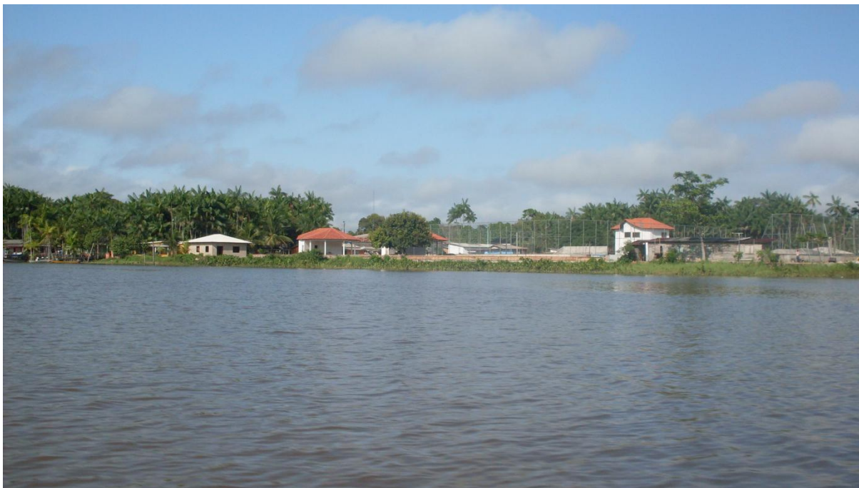
Figura 4 – Mazagão Novo visto do rio.

com Zoneamento ecológico-econômico (2002), o município de Mazagão possui 1.318.960 hectares, faz limite com o município de Santana, Porto Grande, Amapari, Laranjal do Jari e Jari e é dividido em Mazagão Novo ou Sede, local de realização desta pesquisa, e Mazagão Velho.