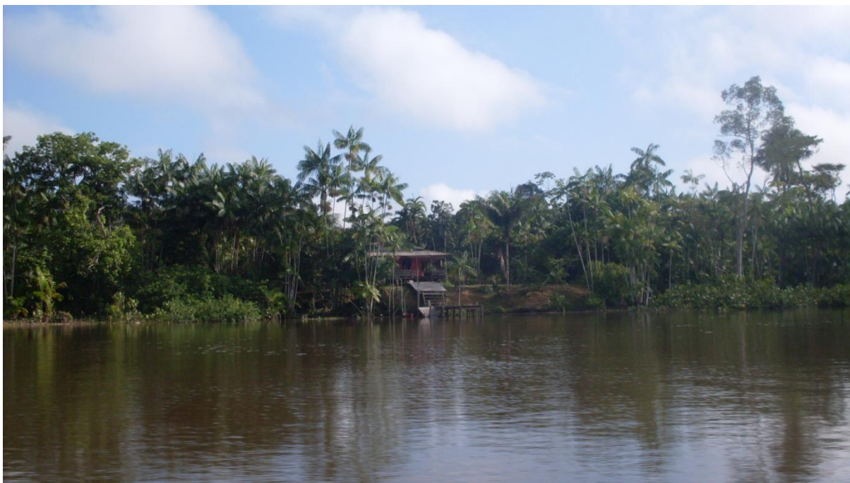
Figura 3 – Casa na beira do rio

Esta composição identitária é marcada historicamente pelo isolamento (Figura 6), no caso das comunidades ribeirinhas, pelo rio e pela mata, local em que este grupo social foi organizado. Os ribeirinhos desenvolveram por conta das diversas peculiaridades uma compreensão específica de ver e viver, na tentativa de explicar os fenômenos e as situações as quais perpassam todos os dias, o ribeirinho apresenta uma cosmovisão que de acordo com Loureiro (1995), é uma visão imaginativa que se consolida das estruturas sociais de cada comunidade ribeirinha. Em relação à cultura: