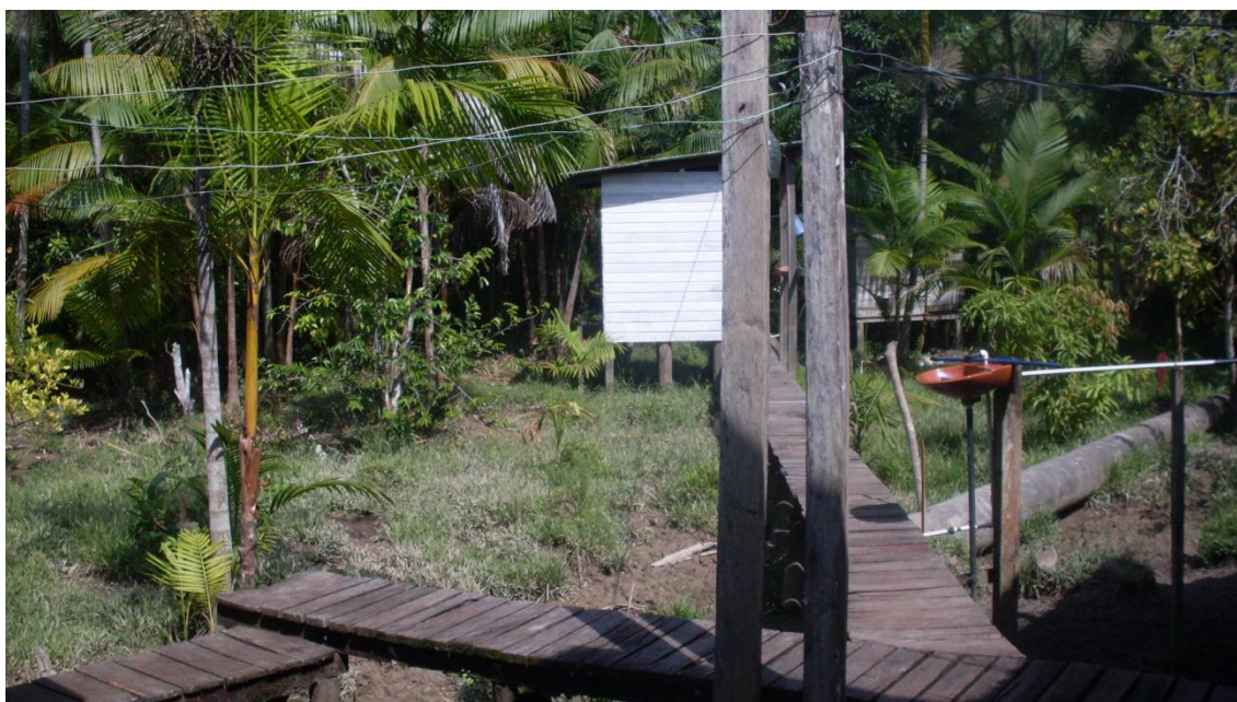
Figura 9 – Rede de energia elétrica da comunidade

As alterações do ambiente rural, inclusive o ribeirinho, com a introdução sem vigilância de novas tecnologias e indefinições dos padrões de remuneração do trabalho, entre outras, nos remetem para um quadro sanitário que não estão solucionadas as questões do estágio anterior e que algumas vezes fazem oposição ao estágio atual.