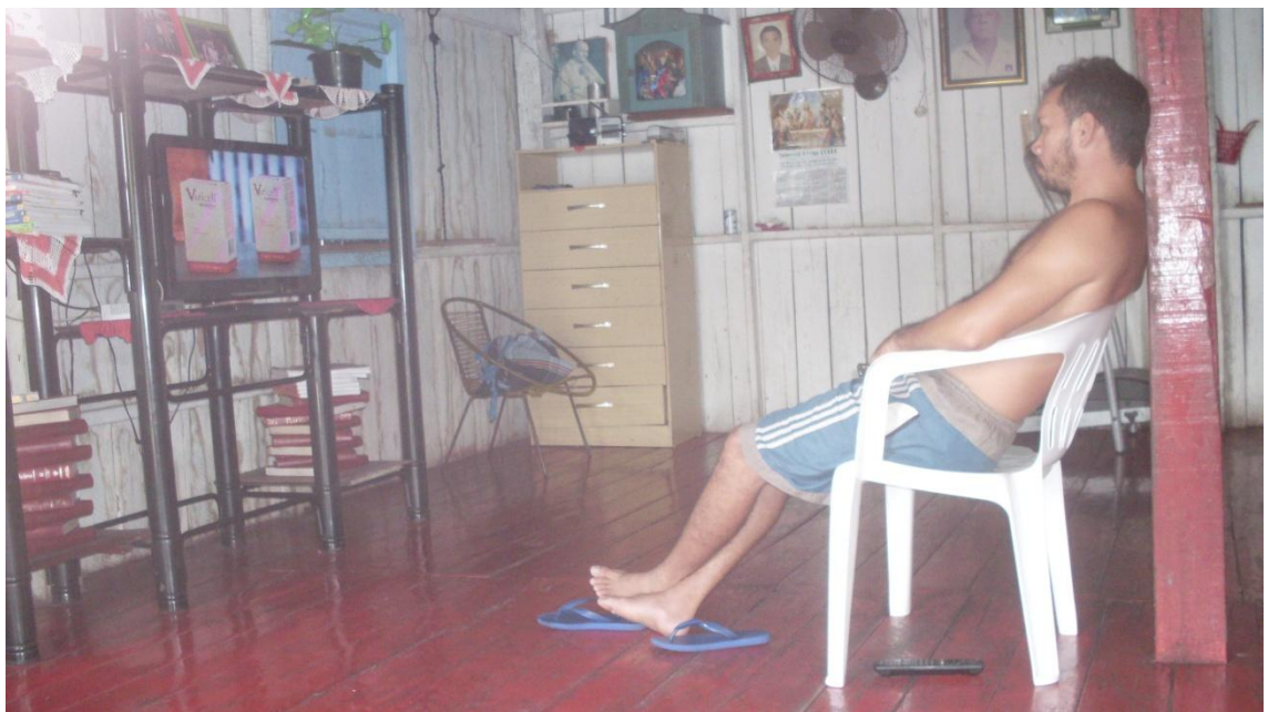
Figura 15 – Morador da comunidade assistindo televisão

Segundo Medeiros (1998) o público mais prejudicado com as informações veiculadas pela mídia é o das crianças, que antes de ter estabelecido valores que concorrerão para a formação de sua personalidade, são atingidas precocemente por tais informações e isso viabiliza a internalização e a perpetuação de valores, dominando e direcionando o inconsciente.