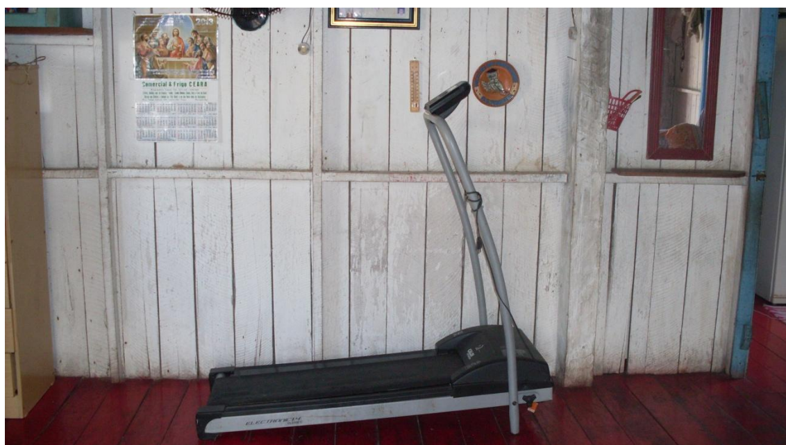
Figura 17 – Esteira da casa de um morador da comunidade

A influencia exercida pelos meios de comunicação é percebida de maneira positiva, de maneira negativa e também de maneira irrelevante, irrelevante não no sentido de que não serviria em local algum mas, no sentido de que por não serem próprias daquele local são até levadas em consideração pelos moradores porém não são utilizadas. No caso da esteira (Figura 17) e da bicicleta (Figura 18).