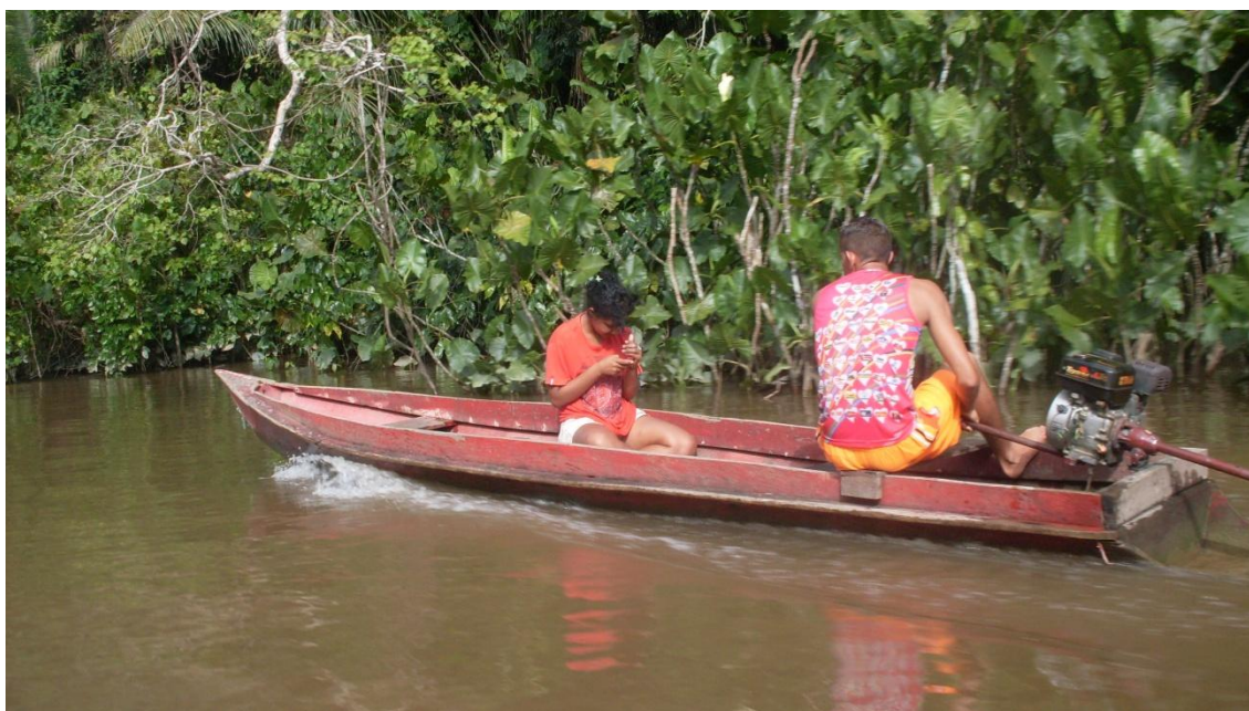
Figura 16 – Ribeirinhos deslocando-se de rabeta e utilizando celular.

Nesse processo desenfreado de globalização corremos o risco da massificação, da submissão, perdemos as nossas referências mais significativas, como as do nosso corpo. A parceria com a tecnologia é fundamental, mas a cultura não se reduz à realidade virtual, há outras referências que dimensionam a cultura, para além da ordenação binária dos objetos cibernéticos, por exemplo, a sensibilidade expressiva da corporeidade.