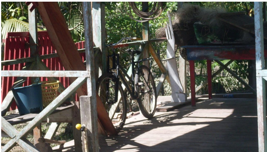
Figura 18 – Bicicleta pertencente a um dos moradores da comunidade