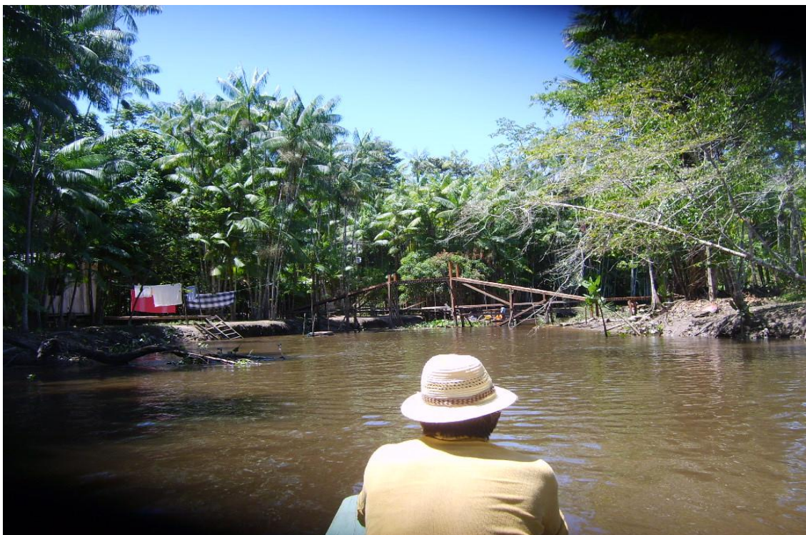
Figura 2 – Ribeirinho no espaço “entre” o rio e a margem

Um retrato deste ambiente cercado pelas águas é a Figura 2 que retrata o ribeirinho em seu caminho diário, no rio que se configura como rua, percorrendo seus caminhos.