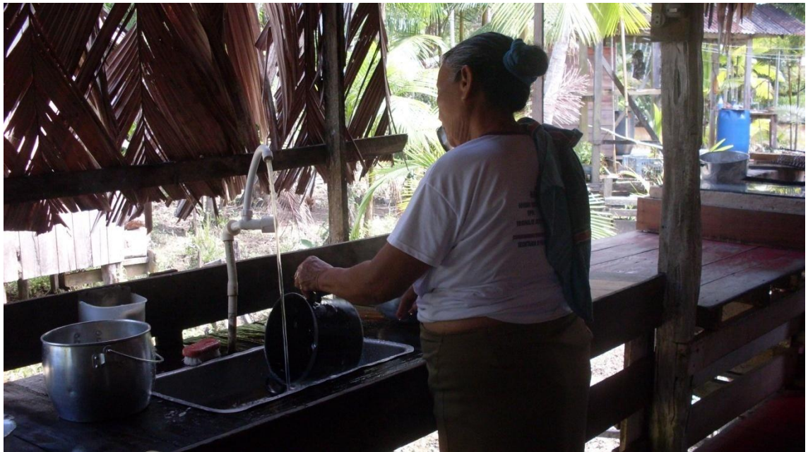
Figura 11 – Moradora em seus afazeres domésticos

Em alguns casos, devido aos conhecimentos repassados de geração para geração, o movimento é visto como nocivo à saúde dos moradores como no caso dos moradores mais velhos do local que retratam que não podem fazer mais nada pois “os osso tão fraco”, nem mesmo as tarefas domésticas (Figura 11) são mais aceitas nesse caso, recebendo a ajuda dos moradores mais novos reiterando que “eu faço as coisa de teimosa, num posso fazer nada”, como se o movimento fosse algo ruim ou mesmo que agilizasse a degeneração do corpo ou ainda que fizesse com que o corpo ficasse propício à doenças, quando de fato é justamente o contrário.