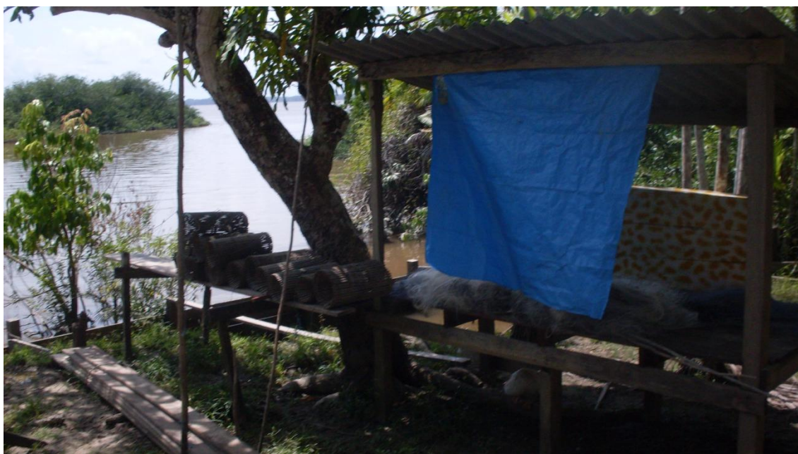
Figura 7 – Matapi e Tarrafa – instrumentos de trabalho ribeirinho

A cultura está ligada a qualquer tipo de prática que organiza o contexto em que cada grupo social se desenvolve, e este segue sua própria lógica. Trata-se de uma experiência de pertencimento e, conseqüentemente, formadora e mantenedora de grupos sociais que compartilham seus modos de vida, princípios e valores culturais.