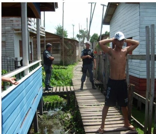
Imagem 04: abordagem nível dois