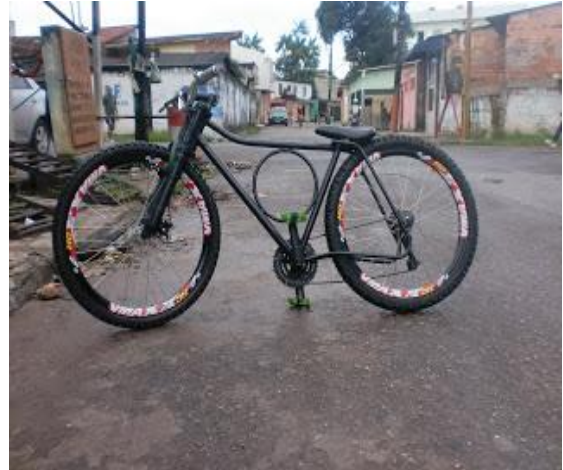
Imagem 09: Bicicleta personalizada 02