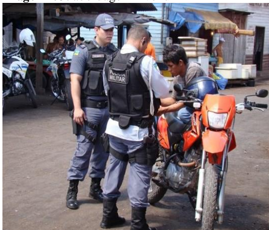
Imagem 03: abordagem nível um

Fonte: www.agenciaamapa.com.br . Acesso: 2014