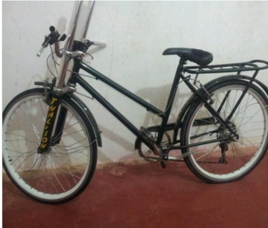
Imagem 08: Bicicleta personalizada 01