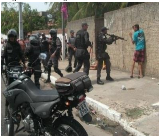
Imagem 05: abordagem nível três

3) Abordagem nível (3) – “É aquela realizada quando há ‘grande suspeição’, onde os indícios são fortes” (POP/0018, 2008). “Nesse nível o constrangimento aos abordados será relativamente desconsiderado, em razão da possibilidade iminente de reação deles” (POLICIAL, 2014). Para esse nível, os policiais atuam de forma constrangedora apenas porque acreditam que os suspeitos poderão reagir à ação do policial, uma ação extremamente subjetiva.