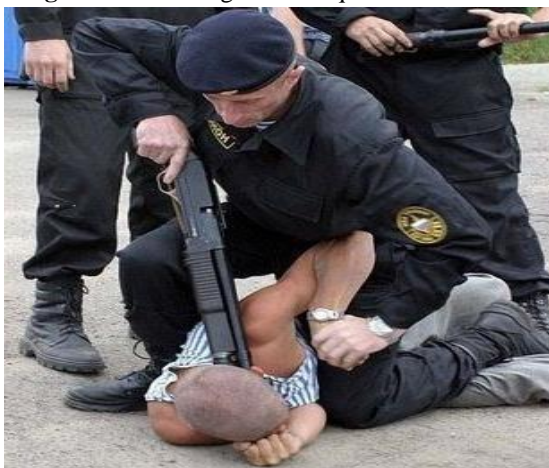
Imagem 06: abordagem nível quatro