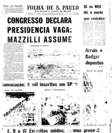
Figura 1: Capa da Folha no dia 02 de abril de 1964, informando a posse de Ranieri Mazzili, após o golpe ao presidente João Goulart

O editorial publicado em 02 de abril de 1964, no dia seguinte à tomada do poder pelos militares, registraram-se, assim, as ações iniciais da ditadura nas primeiras páginas do jornal (UBINSKI, 2014).