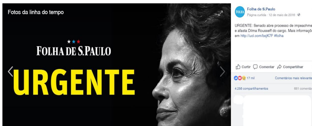
Figura 08: A divulgação da notícia na Fan Page da FSP

Fonte: Folha de S. Paulo, 12 de maio de 2016, Facebook.