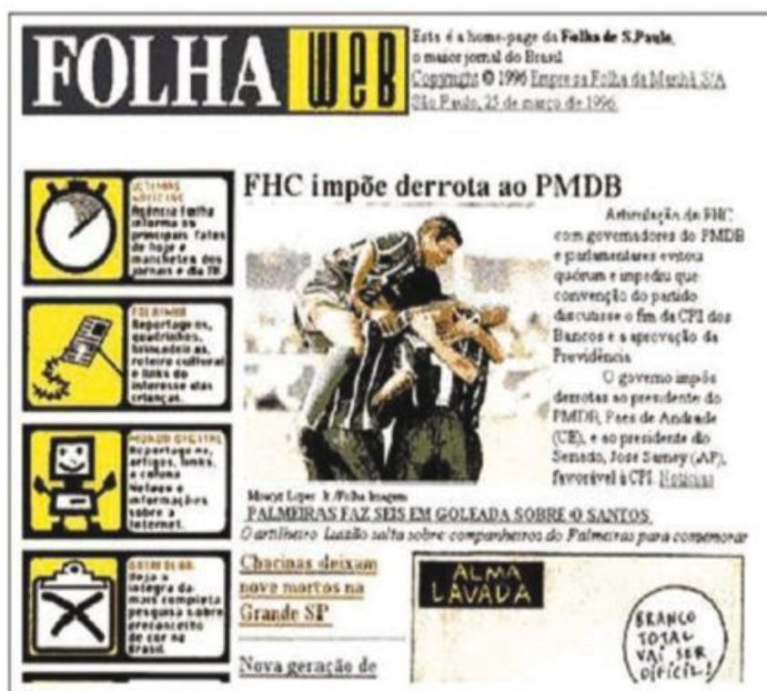
Figura 2: Site da Folha, criado em 09 de julho de 1995.