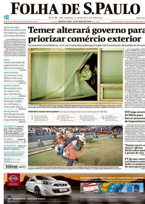
Fonte: < https://acervo.folha.com.br/leitor.do?numero=20588&anchor=6023420&origem=busca >