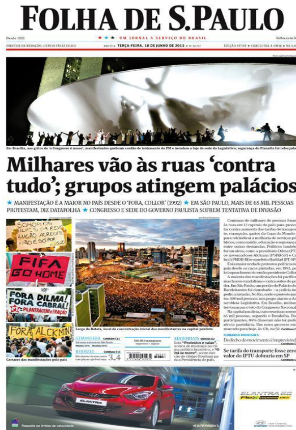
Figura 03: Edição fac-símile da Folha Digital – Notícias sobre a manifestação no Planalto, em 18 de junho de 2016