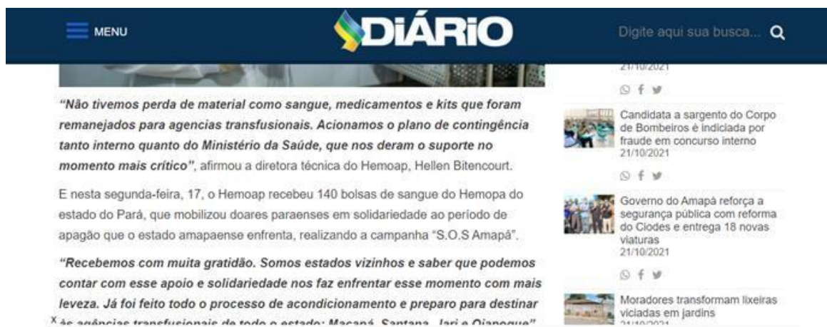
Figura 14: Segunda parte da matéria publicada no site Diário do Amapá