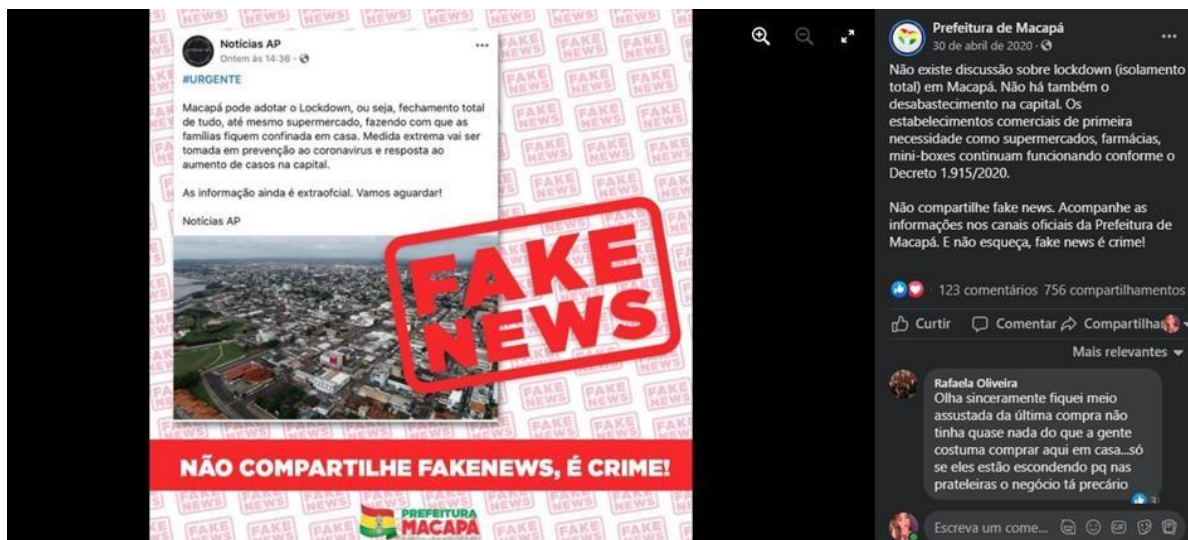
Figura 8: Publicação feita pela prefeitura de Macapá em suas redes sociais.