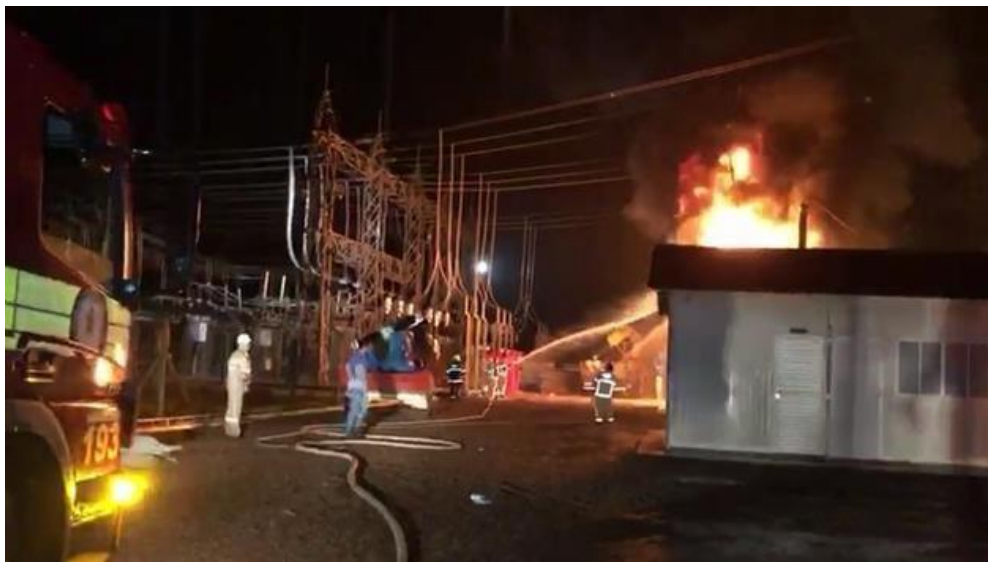
Figura 1: Incêndio na subestação de energia em Macapá.

Às 21h da mesma noite, o serviço de energia elétrica que alimentava os municípios de Calçoene, Cutias, Ferreira Gomes, Itaubal, Mazagão, Pedra Branca do Amapari, Porto Grande, Pracuúba, Santana, Serra do Navio, Tartarugalzinho e Macapá, através da linha Laranjal-Macapá, além das usinas hidrelétricas Coaracy Nunes e Ferreira Gomes, foi interrompido.