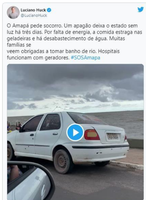
Figura 5: Apresentador Luciano Huck relata o fato na rede social Twitter.

Pensando em mostrar um pouco mais do caos instalado, os usuários amapaenses relataram a situação do Amapá e conseguiram subir a hashtag #SOSAmapá no Twitter, como uma forma de chamar a atenção de autoridades para que tratassem o assunto com atenção e urgência. Todos tinham um só objetivo: buscar respostas e saídas para solucionar o problema da falta de luz nos municípios.