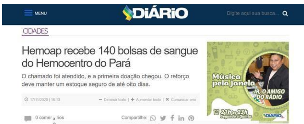
Figura 13: Matéria publicada no site Diário do Amapá que afirma que não houve sangue perdido durante apagão.

Durante esse período foi necessária uma grande atenção dos meios de comunicação para esclarecer os fatos que estavam permeando a sociedade amapaense. Em relação ao falso problema no estoque de sangue do Hemoap, o site Diário do Amapá publicou no dia 17 de novembro uma matéria esclarecendo a situação do Instituto de Hematologia e Hemoterapia diante do apagão (Figura 13).