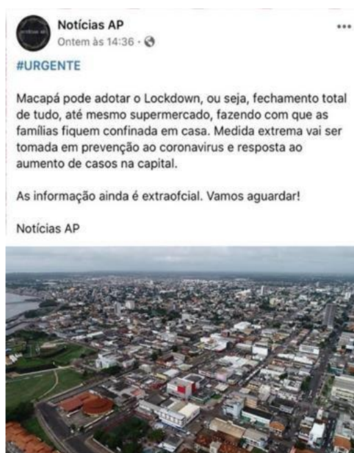
Figura 7: “Notícia” falsa circulando em uma rede social.

A publicação foi realizada após a circulação de áudios na rede social de mensagens instantâneas WhatsApp, e a partir disso, passou a receber uma grande atenção da população. Dessa maneira, o gestor desconhecido apoiado no anonimato acabou se antecipando e postou a informação na rede sem a devida checagem com as autoridades responsáveis. Em poucas horas, a postagem recebeu diversos comentários, curtidas e compartilhamentos, demonstrando um alto alcance entre os usuários da plataforma.