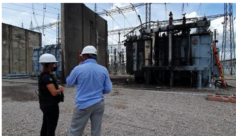
Figura 2: Polícia Civil realizando a inspeção na manhã seguinte do ocorrido.

Durante a primeira semana em que os municípios se encontravam no escuro, a empresa se posicionou alegando que o apagão teria como causa um raio que atingiu o principal gerador de energia responsável por alimentar quase 90% do estado. Porém, a Polícia Civil divulgou laudo em 11 de novembro, descartando a hipótese do raio, deixando assim uma lacuna para a verdadeira causa do problema que atingiu centenas de famílias.