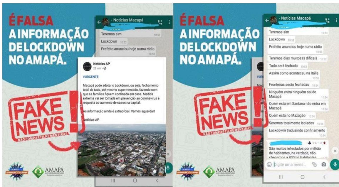
Figura 10: Publicação feita pelo governo do estado do Amapá em suas redes sociais, ampliada para leitura.

Além disso, muitos veículos de comunicação também se manifestaram, com o intuito de tranquilizar as pessoas que estavam acompanhando o momento e não sabiam em quem acreditar. A partir desse momento, a imprensa, junto aos órgãos públicos, realizou um trabalho para levar informação a todos que não tinham acesso à internet, mas que estavam cientes de que estaria “acontecendo” um lockdown nas próximas horas do dia.