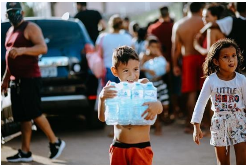
Figura 6: Ação solidária feita em uma área de periferia em Macapá.

No dia 13 de novembro de 2020, a Companhia de Eletricidade do Amapá (CEA) anunciou que o rodízio iniciado há poucos dias deveria durar por mais de treze dias, enquanto o transformador de energia da cidade de Laranjal do Jari não chegasse a Macapá.