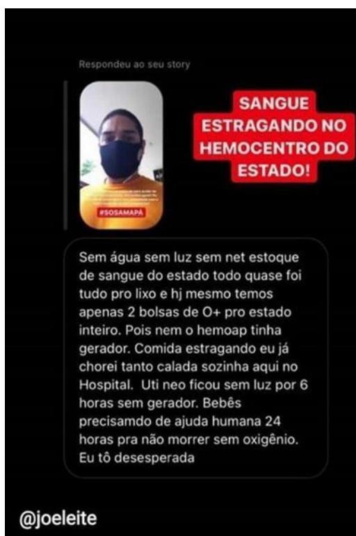
Figura 12: Print compartilhado no WhatsApp.

Segundo Jörn Rüsen (2015), as pessoas buscam suas carências e orientações através de fontes que são capazes de responder suas inquietações e seus sofrimentos; ou seja, em uma situação de desespero é mais fácil uma pessoa aceitar determinadas informações sem ao menos questionar sua veracidade.