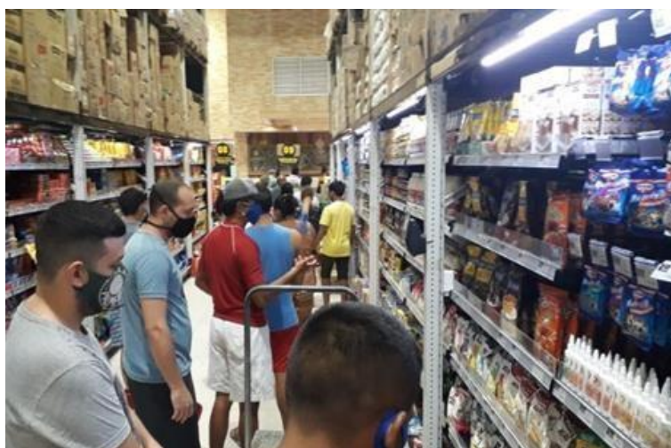
Figura 3: Fila do caixa de um supermercado local.

Além da falta de água, nos primeiros dias do apagão a sociedade amapaense também sofreu com a ausência de serviços de telefonia celular, saques eletrônicos em bancos, compras via cartão de crédito e débito, e as bombas dos postos de gasolina pararam de funcionar. Com poucas condições, a população se viu encurralada e isso gerou um pânico geral, além da corrida aos supermercados, postos de combustíveis, mercantis, lojas de conveniências e entre outros para conseguir estocar em casa alimentos e água.