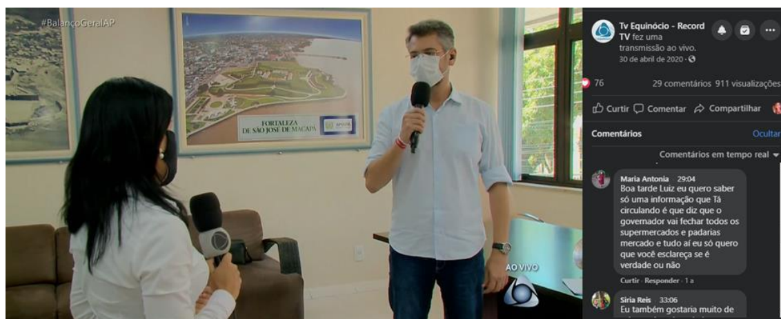
Figura 11: Live produzida pela TV Equinócio no dia da propagação da fake news.

Durante todo o momento da entrevista do prefeito, os internautas questionaram sobre a informação de um possível lockdown. Acompanhando os comentários feitos durante a live, é possível perceber a preocupação e o anseio das pessoas sobre essa falsa informação, mas também a tranquilidade em perceber que a notícia não passou de uma mentira.