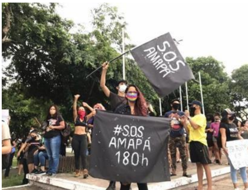
Figura 4: Momentos da manifestação que ocorreu em frente ao palácio do governo e se estendeu para outros pontos da cidade.

Porém, ao mesmo tempo em que isso ocorria na cidade, outras situações ocorriam, a crise permanecia e as pessoas não aguentavam mais a falta de luz, a escassez da água, o aumento de preço nos alimentos e, principalmente, o rodízio de energia que ocorria de forma irregular. Por isso, no dia 11 de novembro (nono dia de apagão) os amapaenses foram até as ruas para dar a sua voz sobre a situação, exigir respostas e pedir socorro através das redes sociais e da imprensa para os demais estados do país.