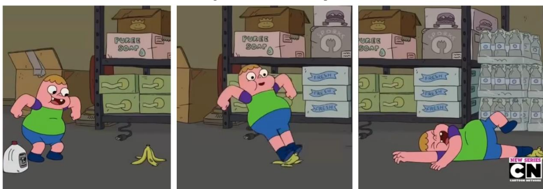
Figura 1: Perdido no supermercado

Da mesma forma que um quali-signo tem relação com um pré-signo, o ícone, característica fundamental da segunda tricotomia, também abarca a primeiridade. Ele é uma representação do objeto em questão, nos faz lembrar algo, porém não necessariamente é o próprio, mas sim a coisa representada.