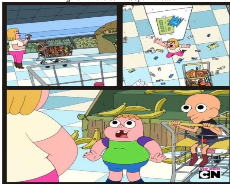
Figura 2: Perdido no Supermercado

Essa “semelhança” da primeiridade que não é, mas que está ligada intrinsecamente como o que é (que existe na secundidade), é fundamental para a compreensão do conceito de Ícone – que também não é em si, mas se assemelha a um objeto-outro que representa. (MARTINS, 2015, p. 239).