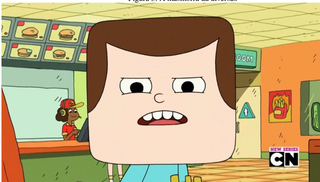
Figura 3: A masmorra da diversão