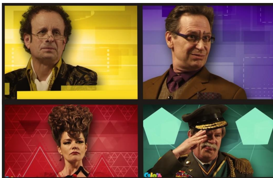
Figura 9: Mistério no Solar Geometria

Assim, o episódio trata de racionalidades, ou seja, conhecimentos que estão baseados na lógica. Diferentemente da primeiridade, que compreende o sensível do interpretador, a terceira categoria dos signos requer uma observação mais determinada e normatizada, como é o caso do episódio que ensina ao telespectador mirim os assuntos matemáticos através da Geometria.